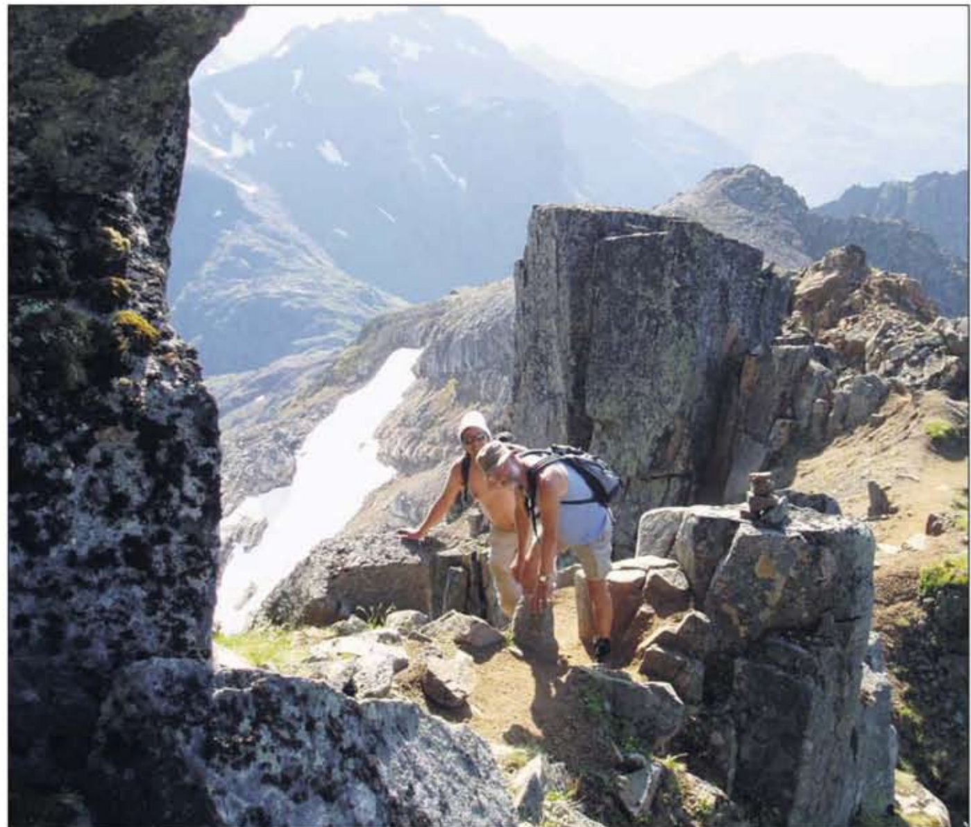
Det bratte Memuruskaret krever kondisjon og lår og legger. Lenger oppe i ruta er det flere luftige passasjer. Har du høydeskrekk bør du finne deg et anna turmål.