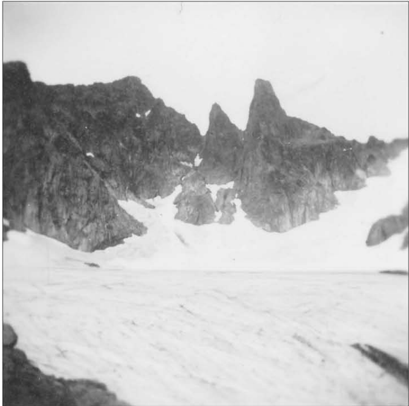
Når du skal på Møysalen fra Lonkanfjorden eller Øksfjorden, må du gå over to breer. Fonnisen heter den nederste, en botnbre som ligger sørvendt og med ei stor skinnende kvit flate, syntlig så langt Møysalen er det. I varme somre får Fonnisen skitten, brun farge med mørke striper. Her Aksla, Fonnisen og Møylene i 1951.

Da miljøvernminister Børge Brende åpna Møysalen nasjonalpark, var ordførerne fra de tre nasjonalparkkommunene Hadsel, Lødingen og Sortland til stede. Åpninga foregikk i Vestpollen 4. september 2003. Det er meg fortalt at representanter fra Innlandet ikke var invitert.