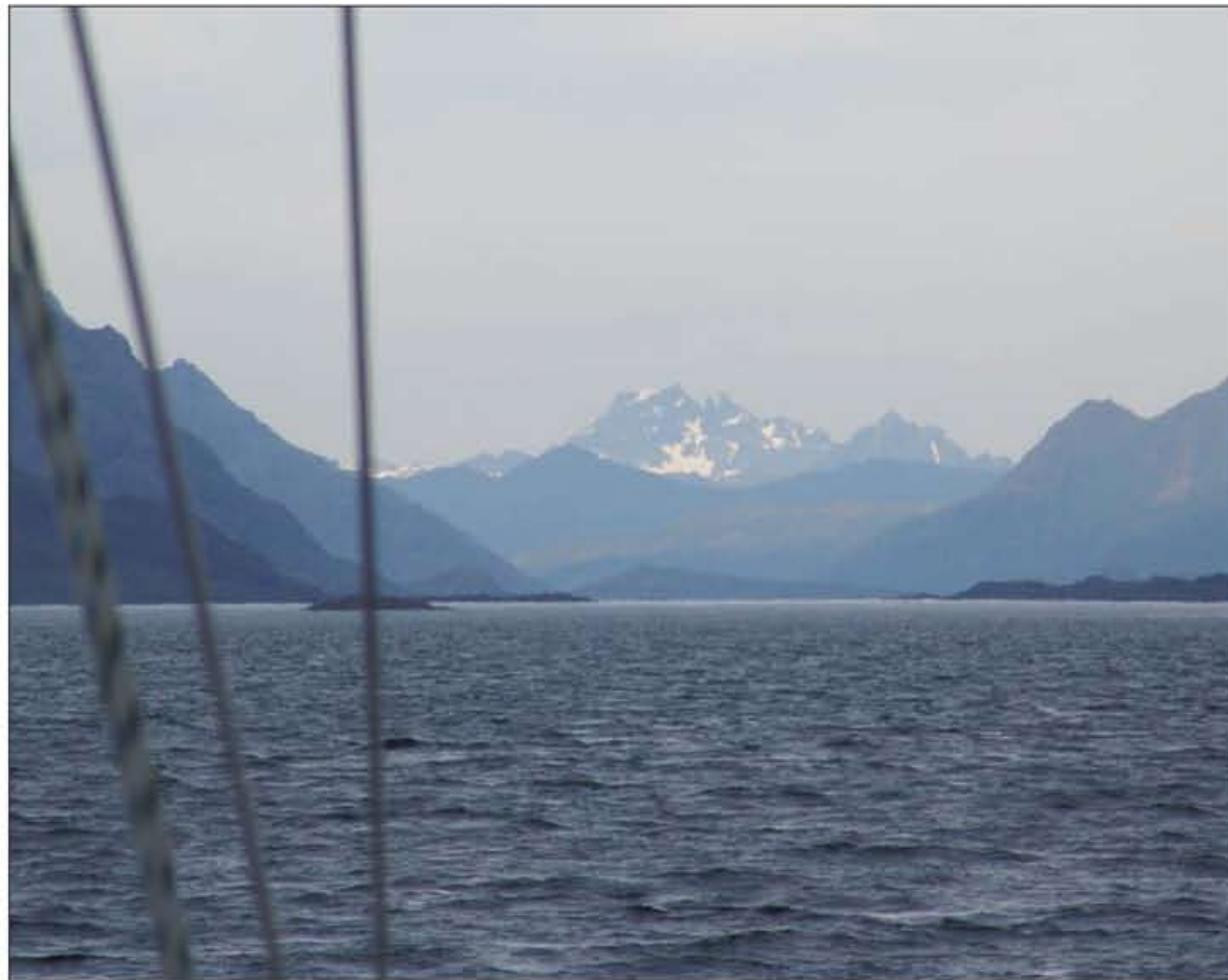
Møysalen skinner som et Soria Moria nord i sundene, her sett fra Øyhellsundet. Store Molla th og Austvågøya tv i bildet.

Den offisielle presentasjonen om Møysalen nasjonalpark forteller ikke om det landskapet jeg har lært å kjenne! Far min var folkeminnesamler og landskapskjenner. Ei vakker juninatt i år måtte han på si siste vandring, og mye viten gikk i grava med han. Arven etter han er fortellingene han samla, og her finner vi bilder om skikkelser og om landskap, steder og navn i heimlandet mellom Møysalen og Raftsundet.